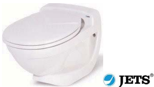
Toaletten från Jets finns både i golv- och väggmonterad version.