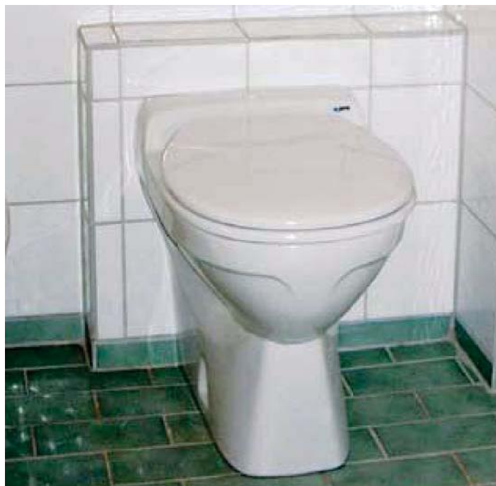
Med en vakuumtoalett får du samma komfort som hemma med en riktig vattentoalett i porslin.

Man spolrar toaletten med en enkel knapptryckning, precis som på kryssningsfartyg, flygplan och tåg. Avfallet pumpas till förbränning och då går det mesta upp i vattenånga, kvar blir endast en mycket liten mängd aska. Toalettstolen monteras inomhus i badrum eller toalettutrymme precis som hemma.